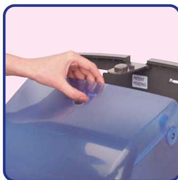
Ouvrir la façade