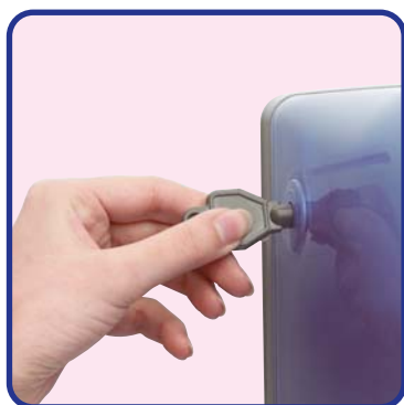
Déverrouiller des 2 côtés

La mise en place du papier d'essuyage est facile et très rapide