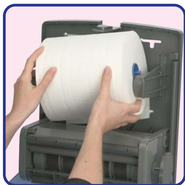
Insérer la bobine