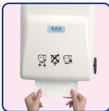
Il est prêt à fonctionner

Choisissez le distributeur le mieux adapté à votre métier.