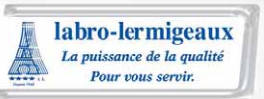
PLATE-FORME RÉGIONALE ÎLE-DE-FRANCE